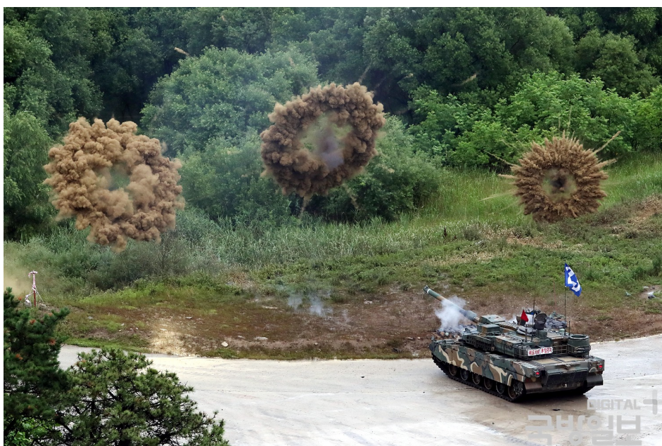
Figur 1 Koreansk K2 kampvogn.

Disse internationale samarbejdsaftaler er en vigtig del af Polens langsigtede plan om et mere selvforsynende forsvar.