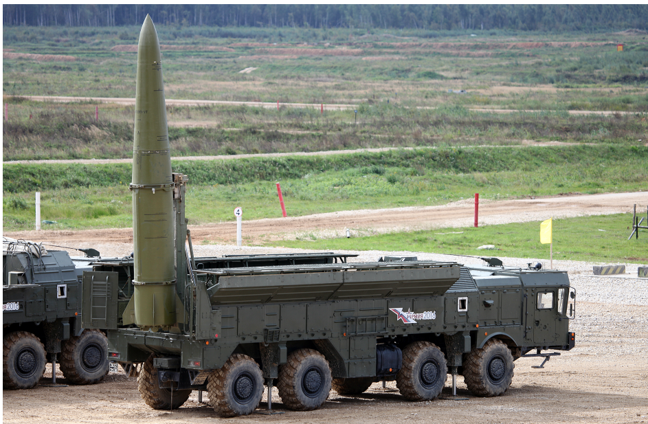
Billede 3 Iskander-M SRBM system med 9M723K5 missil.

Der blev brugt mange missiler – men deres spredning over det enorme ukrainske territorium gør antallet mindre imponerende. Fra 24. februar 2022 til slutningen maj 2022 affyrede Rusland mere end 2.000 Kalibr- og Iskander-missiler. 11 Der skete undervejs en ændring af mål fra luftforsvarssystemer til infrastruktur, men der blev i gennemsnit kun affyret 30 missiler om dagen. Det er forfærdeligt for dem der rammes, men bombardementet er ikke massivt med missiler.