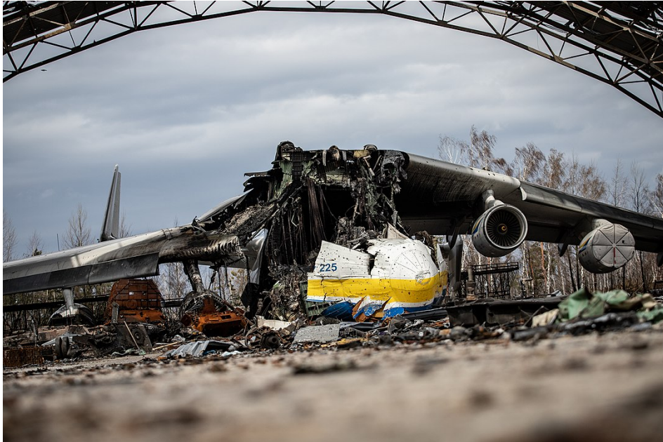
Billede 1 Billede Antonov An-225 Mriya, det største fly nogensinde bygget, blev ødelagt under slaget ved Antonov Lufthavn.

Beretninger fra præsident Volodymyr Zelenskyi, som hævder, at han selv var bare få minutter fra at blive taget til fange og dræbt, kan tyde på at Putins strategi kan have været nærmere succes, end vi kan lide at tænke på. 8 Det er interessant at tænke på, hvordan de vestlige reaktioner efter sådan en operation ville have været. De havde nok ikke været så stærke som i dag, hvor vi har oplevet styrken af Ukrainernes modstandskraft.