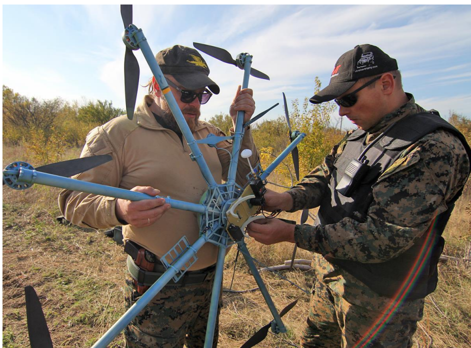
Billede 2 Ukrainsk R18 drone – her vist som prototype. Dronen kan både bruges til observation og kaste mindre sprængladninger.

Da konflikten blev mere statisk med fokus rettet mod fronten i Donbas, blev dronernes rolle som angrebsvåben mindre udtalt, dog var de stadig vigtige ift. artilleri observationer. I hele krigen har der været indsat droner fra de langtrækkende droner til medium droner og ned til de små kommercielle droner. I medierne fylder historier om f.eks. de amerikanske Switchblade meget, og der kan hurtigt blive en hurra-stemning, der overdriber betydningen. 9