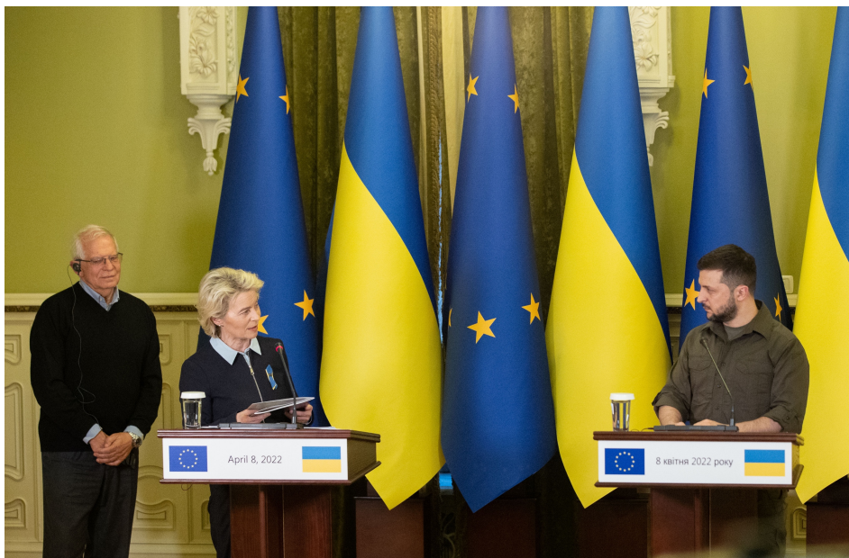
Billede 7 Møde mellem Ukraines præsident med formanden for Europa-Kommissionen og EU's højtstående repræsentant for udenrigsanliggender og sikkerhedspolitik.

Her er USA og Canada i en særlig position. Det er et faktum at sanktionspakkerne har skadet Ruslands produktion og udenlandske investeringer i Rusland, og at den russiske import og eksport er gået ned. 38 Det er også et faktum, at Rusland mangler gasrørledninger til at forbinde Vest- og Østsibirien og Vestsibirien og Kina, og at sidst nævnte mulighed, her illustreret af den atlantiske transsibiriske rørledning, tidligere har været dybt hæmmet af en mangel på kinesisk interesse og investering. Dette kan dog hurtigt ændre sig, hvis vi ser yderligere kriser, som den nuværende i Taiwan, i forholdet mellem USA og Kina.