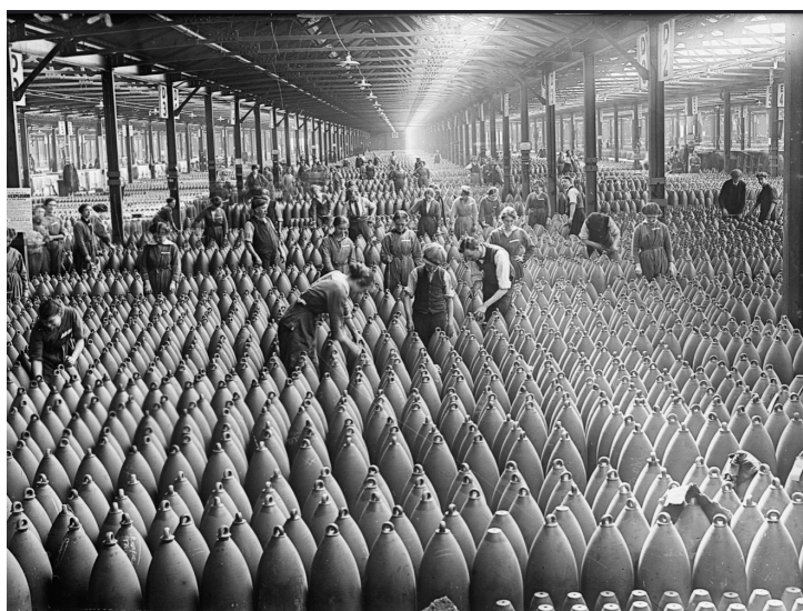
Billede 5 Ukrainekrigen har fået en industriel størrelse og er helt afhængig af meget store forsyninger. Parallelen til Første og Anden Verdenskrigs forsvarsindustrielle produktion er klar.

Det står i dag lysende klart, at en krig som Ukraine-krigen, er krig på industriel basis, som Første og Anden Verdenskrig. Det kræver en hurtig omstilling fra det nuværende "just-in-time" til en strømlinet høj produktion kombineret med store lagre. 30 'Just in time' har måske været Vestens ideologiske skyklapper.