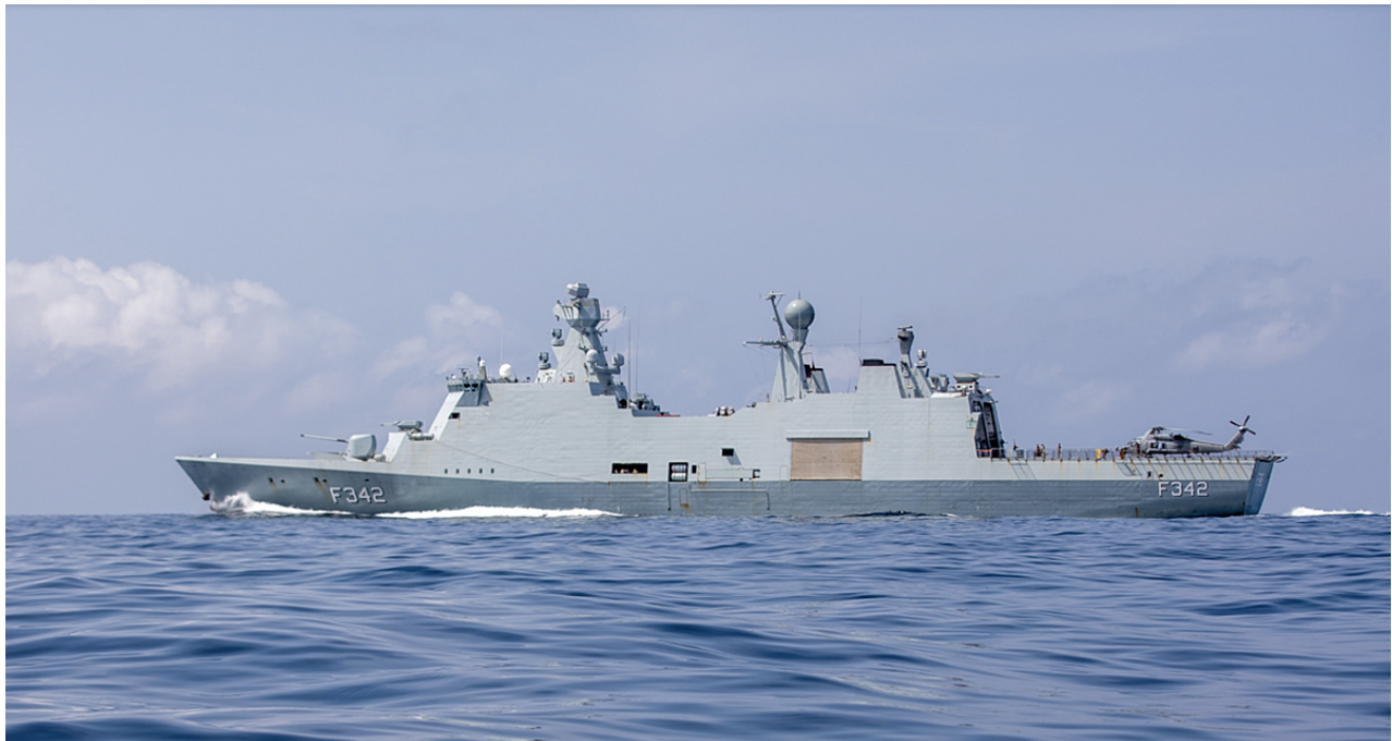
Fregatten Esbern Snare i Guinea-bugten.

Den store udfordring er, hvordan og hvem der skal retsforfølge pirater - et problem man også havde i Adenbugten. Dette er på nuværende tidspunkt ikke afklaret. Problemet er bl.a. hvilke stat har jurisdiktion, hvor kommer piraterne fra, kan man udlever dem til lokale myndigheder under betryggende forhold.