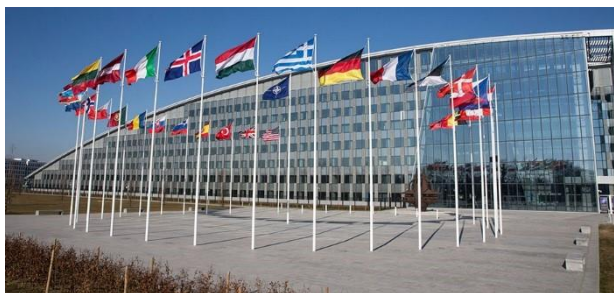
Det nye NATO-hovedkvarter i Belgien, der rummer NATO's aktiviteter, hvor de overordnede beslutninger træffes af Det nordatlantiske Råd.